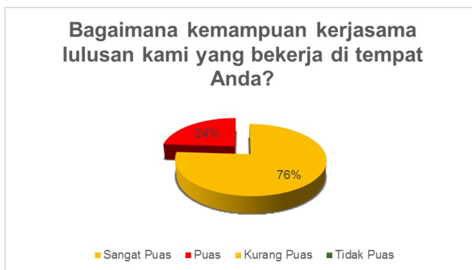
Gambar 4. Kondisi Kepuasan Pengguna terhadap aspek kemampuan bekerjasama dalam tim (Sumber: Hasil Analisis)

Hasil survey menunjukkan kemampuan bekerjasama dalam suatu tim lulusan harus ditingkatkan agar menjadi lebih baik.