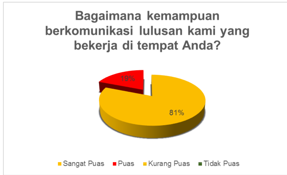
Gambar 5. Kondisi Kepuasan Pengguna terhadap aspek kemampuan berkomunikasi

Diagram di atas menunjukkan kepuasan pengguna terhadap kemampuan berkomunikasi dari alumni Program Studi Administrasi Publik Fakultas Ilmu Sosial dan Ilmu Politik Universitas Iskandar Muda sebesar 81% kategori sangat puas dan 19% responden menyatakan puas terhadap kemampuan komunikasi. Kemampuan komunikasi merupakan salah satu faktor penting yang mendukung keberhasilan lulusan dalam pekerjaannya. Hasil survey menunjukkan kemampuan komunikasi lulusan Sangat baik. Sejalan dengan itu Program Studi Administrasi Publik Fakultas Ilmu Sosial dan Ilmu Politik Universitas Iskandar Muda juga melakukan berbagai upaya untuk meningkatkan kemampuan komunikasi calon calon lulusan dalam meningkatkan komunikasi dengan memberikan pelatihan komunikasi. Pelatihan peningkatan komunikasi terutama untuk keberhasilan interview atau wawancara