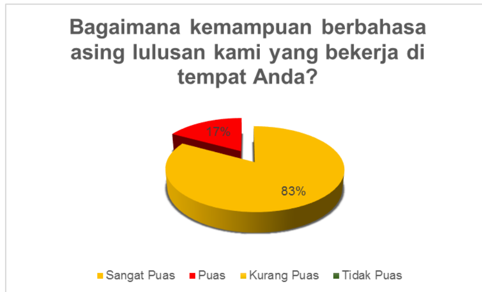
Gambar 6. Kondisi Kepuasan Pengguna terhadap aspek kemampuan berbahasa inggris

Gambar 6 Menampilkan persepsi stakeholder terkait dengan kemampuan alumni dalam berkomunikasi dalam bahasa asing. Dari Gambar tersebut dapat dilihat bahwa secara umum stakeholder menilai alumni mempunyai kemampuan dalam berkomunikasi secara lisan. Namun dengan mempertimbangkan bahwa cukup besar stakeholder yang memberikan penilaian cukup terhadap aspek ini, menunjukkan perlunya adanya penambahan bekal dalam kaitannya dengan kemampuan alumni dalam berkomunikasi dalam bahasa asing. Artinya Program Studi Administrasi Publik Fakultas Ilmu Sosial dan Ilmu Politik Universitas Iskandar Muda perlu memberikan tambahan Softskill bahasa asing untuk meningkatkan kemampuan lulusan.