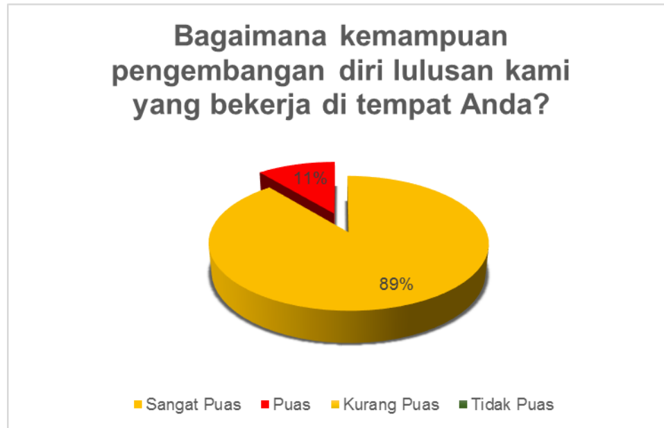
Gambar 8. Kondisi Kepuasan Pengguna terhadap aspek upaya pengembangan diri

Gambar 8 Menampilkan persepsi stakeholder tentang kemampuan alumni dalam mengembangkan diri. Dari Gambar tersebut dapat dilihat bahwa secara umum stakeholder mempunyai persepsi yang baik terhadap alumni dalam aspek-aspek yang dinilai yaitu sebesar 11 % menjawab baik dan 89% Stakeholder menjawab Sangat Baik. Salah satu kompetensi utama lulusan Program Studi Administrasi Publik Fakultas Ilmu Sosial dan Ilmu Politik Universitas Iskandar Muda adalah kewajiban lulusan memiliki kesadaran akan pentingnya belajar seumur hidup dan kemampuan untuk menjalankannya. Hal ini didukung oleh adanya kurikulum berbasis kompetensi yang memberikan peluang bagi mahasiswa untuk melatih diri secara hardskill maupun softskill. Hasil survey tanggapan pengguna lulusan menunjukkan lulusan sudah memiliki kemampuan pengembangan diri yang cukup baik, Program Studi Administrasi Publik Fakultas Ilmu Sosial dan Ilmu Politik Universitas Iskandar Muda akan terus mendorong mahasiswa untuk lebih