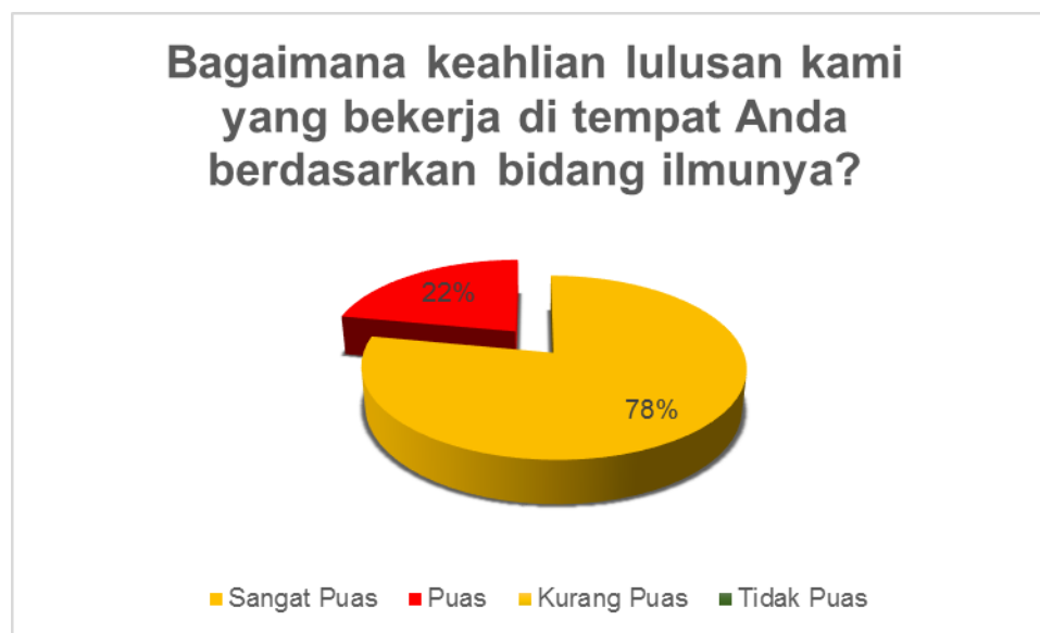
Gambar 3. Kondisi Kepuasan Pengguna terhadap aspek kompetensi utama

Gambar 3 menampilkan persepsi stakeholder terkait dengan kemampuan kompetensi utama. Dari Gambar tersebut dapat dilihat bahwa pengguna lulusan Program Studi Administrasi Publik Fakultas Ilmu Sosial dan Ilmu Politik Universitas Iskandar Muda memberikan tanggapan sangat puas sebesar 78%. Profesionalisme menunjukkan komitmen para anggota suatu profesi untuk