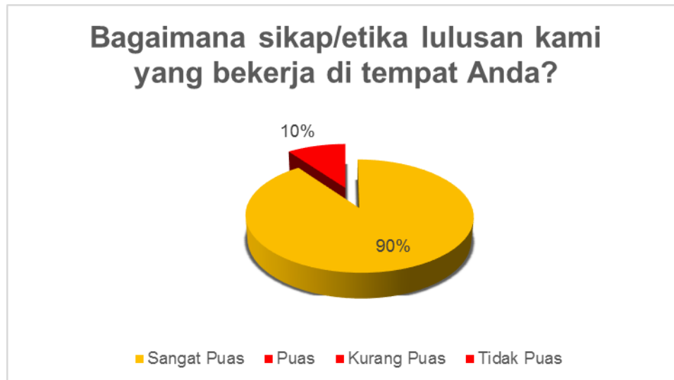
Gambar 2. Kondisi Kepuasan Pengguna terhadap aspek etika

Gambar 2 menampilkan persepsi stakeholder terkait dengan etika & moral mahasiswa. Dari grafik tersebut dapat dilihat bahwa secara umum stakeholder sangat puas dengan etika dimana alumni mempunyai etika & moral yang baik. Capain