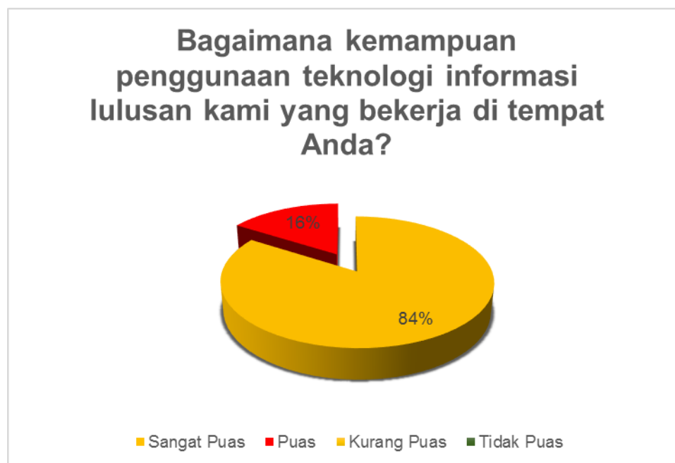
Gambar 7. Kondisi Kepuasan Pengguna terhadap aspek kemampuan penggunaan teknologi informasi