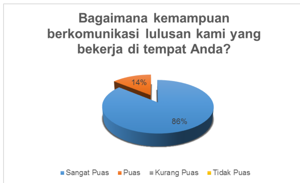
Gambar 5. Kondisi Kepuasan Pengguna terhadap aspek kemampuan berkomunikasi

Diagram di atas menunjukkan kepuasan pengguna terhadap kemampuan berkomunikasi dari alumni Program Studi Administrasi Publik Fakultas Ilmu Sosial dan Ilmu Politik Universitas Iskandar Muda sebesar 86% kategori sangat puas dan 14% responden menyatakan puas terhadap kemampuan komunikasi. Kemampuan komunikasi merupakan salah satu faktor penting yang mendukung keberhasilan lulusan dalam pekerjaannya. Hasil survey menunjukkan kemampuan komunikasi lulusan Sangat baik. Sejalan dengan itu Program Studi Administrasi Publik Fakultas Ilmu Sosial dan Ilmu Politik Universitas Iskandar Muda juga melakukan berbagai