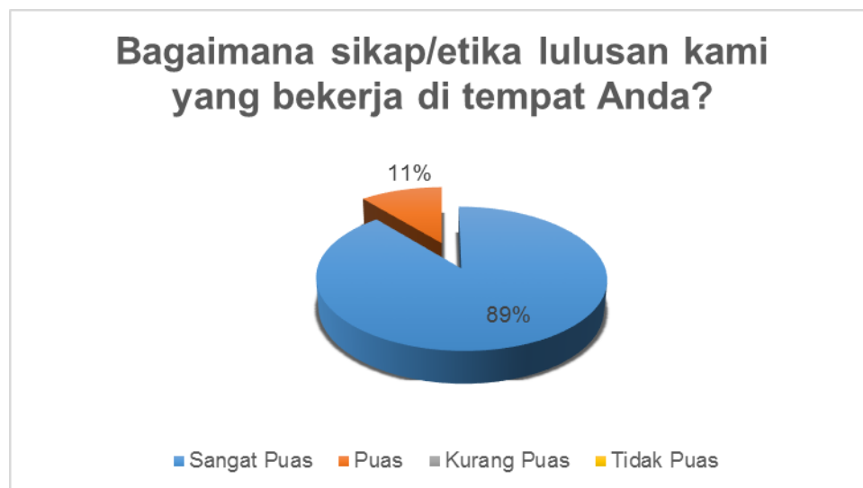
Gambar 2. Kondisi Kepuasan Pengguna teradap aspek etika