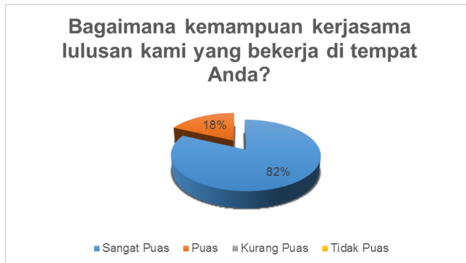
Gambar 4. Kondisi Kepuasan Pengguna terhadap aspek kemampuan bekerjasama dalam tim (Sumber: Hasil Analisis)

Hasil survey menunjukkan kemampuan bekerjasama dalam suatu tim lulusan harus ditingkatkan agar menjadi lebih baik.