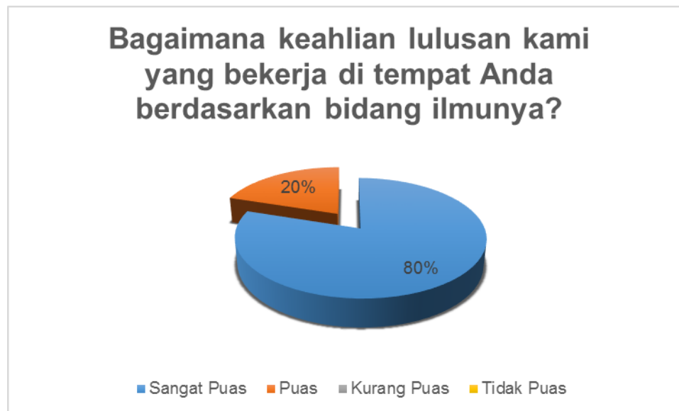
Gambar 3. Kondisi Kepuasan Pengguna terhadap aspek kompetensi utama (Sumber: Hasil Analisis)