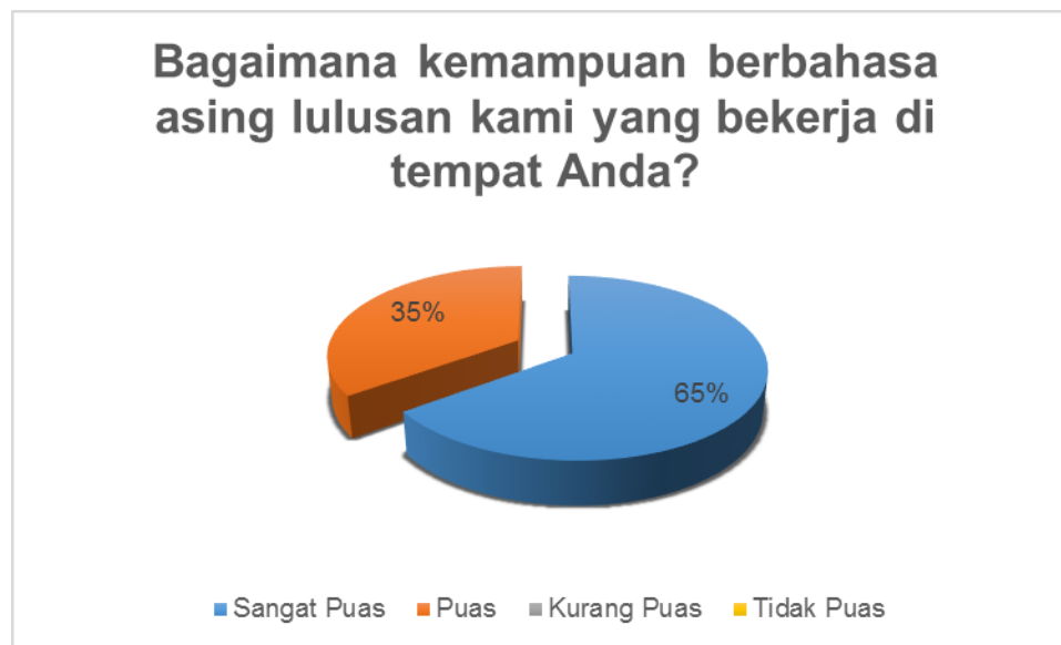
Gambar 6. Kondisi Kepuasan Pengguna terhadap aspek kemampuan berbahasa Inggris

Gambar 6 Menampilkan persepsi stakeholder terkait dengan kemampuan alumni dalam berkomunikasi dalam bahasa asing. Dari Gambar tersebut dapat dilihat bahwa secara umum stakeholder menilai alumni mempunyai kemampuan dalam berkomunikasi secara lisan. Namun dengan mempertimbangkan bahwa cukup besar stakeholder yang memberikan penilaian puas terhadap aspek ini, menunjukkan perlunya adanya penambahan bekal dalam kaitannya dengan kemampuan alumni dalam berkomunikasi dalam bahasa asing. Artinya Program Studi Administrasi Publik Fakultas Ilmu Sosial dan Ilmu Politik Universitas Iskandar Muda perlu memberikan tambahan Softskill bahasa asing untuk meningkatkan kemampuan lulusan.