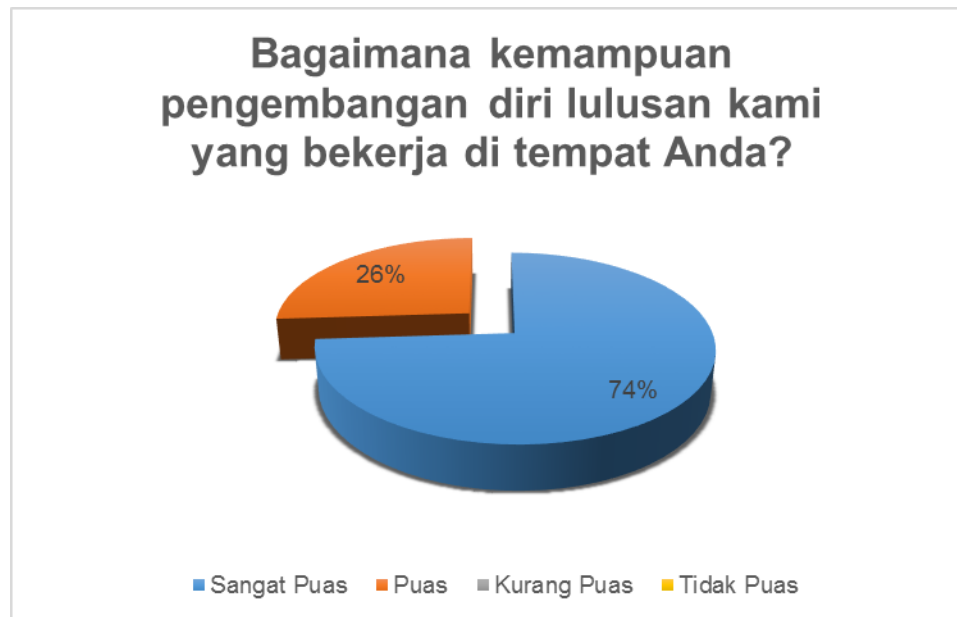
Gambar 8. Kondisi Kepuasan Pengguna teradap aspek upaya pengembangan diri

Gambar 8 Menampilkan persepsi stakeholder tentang kemampuan alumni dalam mengembangkan diri. Dari Gambar tersebut dapat dilihat bahwa secara umum stakeholder mempunyai persepsi yang baik terhadap alumni dalam aspek-aspek yang dinilai yaitu sebesar 26 % menjawab baik dan 74% Stakeholder menjawab Sangat Baik. Salah satu kompetensi utama lulusan Program Studi Administrasi Publik Fakultas Ilmu Sosial dan Ilmu Politik Universitas Iskandar Muda adalah kewajiban lulusan memiliki kesadaran akan pentingnya belajar seumur hidup dan kemampuan untuk menjalankannya. Hal ini didukung oleh adanya kurikulum berbasis kompetensi yang memberikan peluang bagi mahasiswa untuk melatih diri secara hardskill maupun softskill. Hasil survey tanggapan pengguna lulusan menunjukkan lulusan sudah memiliki kemampuan pengembangan diri yang cukup baik, Program Studi Administrasi Publik Fakultas Ilmu Sosial dan Ilmu Politik Universitas Iskandar Muda akan terus mendorong mahasiswa untuk lebih membuka diri dan menambah wawasan intelektualnya baik dibidang umum maupun agama.